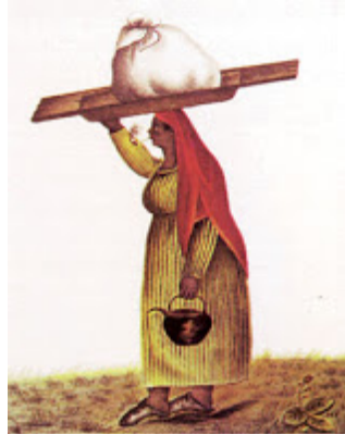
AL CRUZAR LA CORDILLERA