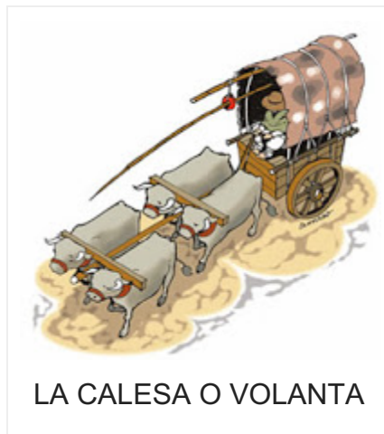
LA CALESA O VOLANTA

La gente de alcurnia tenía carruajes que servían para trasladarlos tanto dentro de la ciudad como a los alrededores. La calesa o volanta era la más usada.