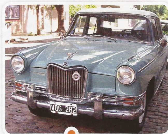
En el modelo de Industrialización por Sustitución de Importaciones, el Estado argentino intervino con nuevas medidas. En la imagen, el Siam Di Tella.

Durante el período de industrialización, se profundizaron las diferencias regionales que se habían fijado en el modelo económico-productivo previo. Luego de 1955, tanto las inversiones nacionales como las extranjeras, se concentraron en la Ciudad de Buenos Aires y en varios partidos del conurbano bonaerense, y, en menor cantidad, en las ciudades de Córdoba y Rosario. Paulatinamente, se conformó alrededor de estas ciudades lo que luego se denominó el "cinturón industrial" o "frente fluvial industrial", que bordea los ríos Paraná y de la Plata, y une a su vez el borde industrial del Riachuelo.