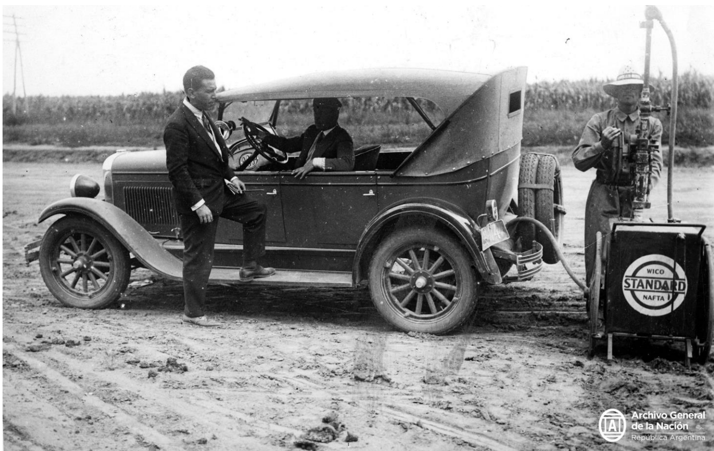
Ilustración 2 ↑ Con el aumento del uso de los automóviles en 1920, la Argentina incurrió en la fabricación y reparación de neumáticos, así como de partes del automotor. El asfalto y los derivados del petróleo no fueron la excepción.