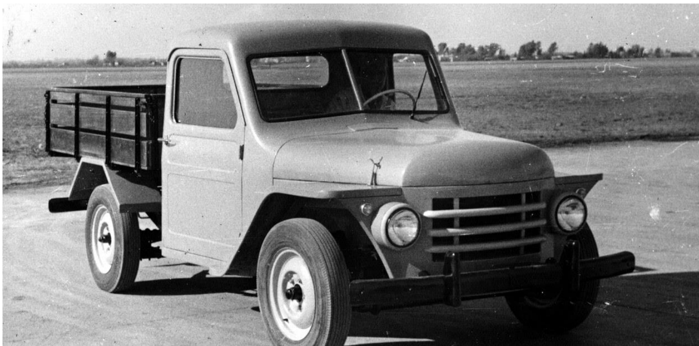
Ilustración 1 ↑ Rastrojero. Este fue el nombre que se le dio a las camionetas y furgones fabricados y desarrollados en Argentina por Industrias Aeronáuticas y Mecánicas del Estado (IAME),). Se trató de una serie de vehículos diseñados y desarrollados para ser utilizados como utilitarios de carga. Se fabricaron entre 1952 y 1979.